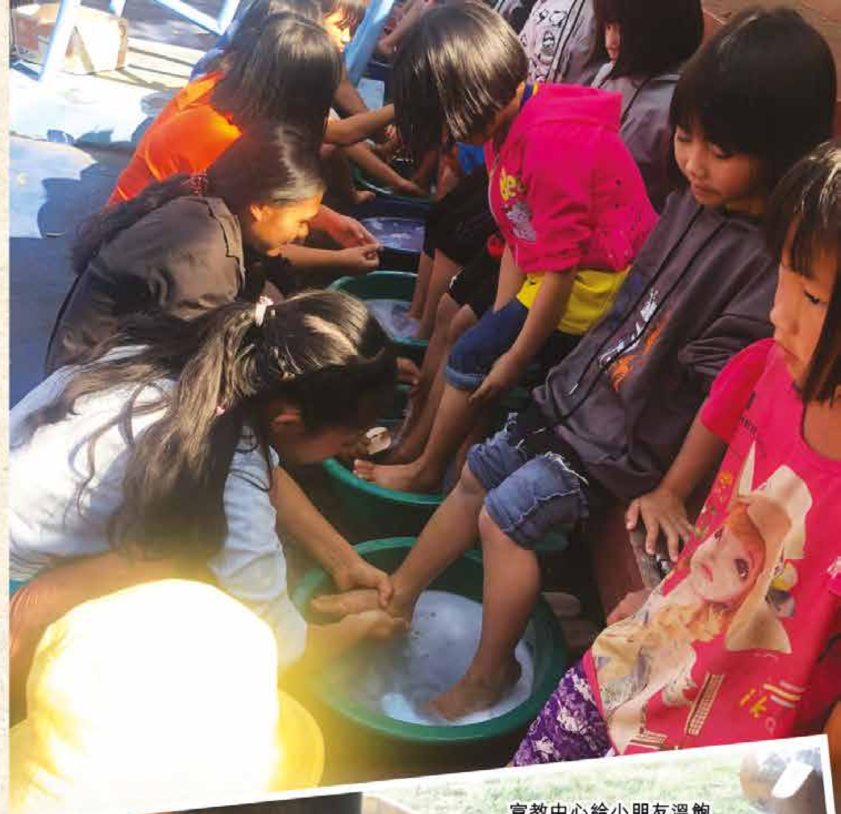
宣教中心給小朋友溫飽