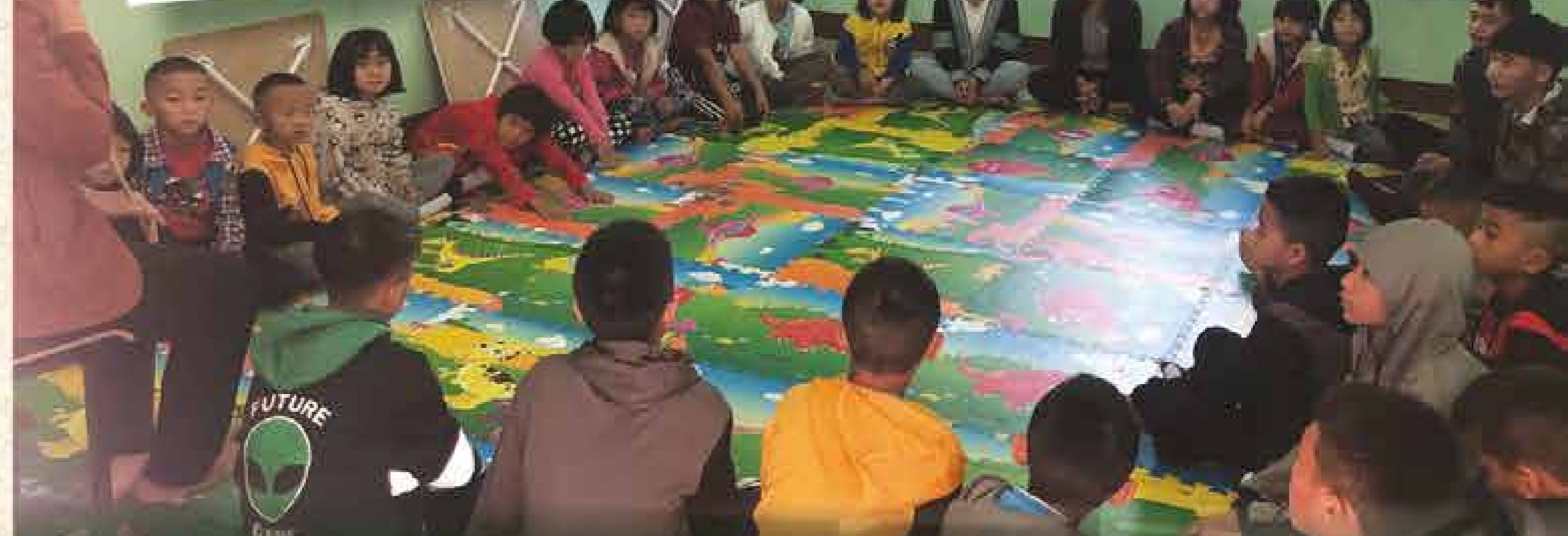
天恩學生正教導中文、泰文及上帝的話語